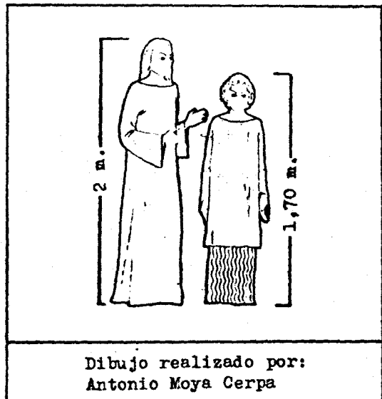
Dibujo realizado por: Antonio Moya Cerpa

"hombre verde" de lm. 20 aproximadamente de alto, los cuales a través de toda la historia de la Ufología, nunca se habían visto juntos.